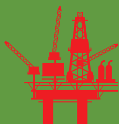
Royal Dutch Shell