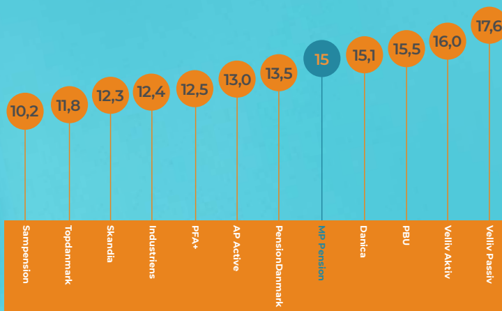
Afkast i procent 2019 (middel risiko, 10 år til pension) ifølge Morningstar.

Fra 2009 til 2019 har MP Pension haft et gennemsnitligt afkast på 9 procent. Det placerer os i toppen af det danske pensionsmarked, når vi bliver målt op imod pensionsprodukter med samme risikoprofil ifølge det uafhængige analysehus Morningstar.